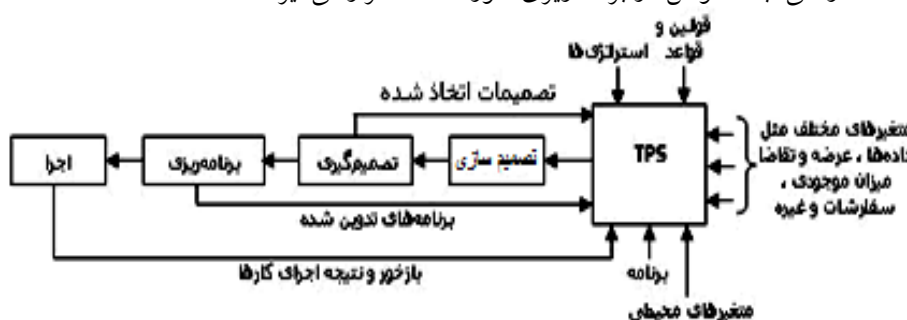
شکل ۱. مدل کلاسیک TPS (محمودی، ۱۳۹۴)

سیستم پردازش تراکنش (تبادلات و دادوستد) مطابق شکل ۱، به سیستم‌های هوشمند و خودکاری گفته می‌شود که به صورت تعاملی، پویا و بی‌درنگ، داده‌ها و متغیرهای اطلاعاتی را از منابع مختلف دریافت کرده و طبق برنامه‌ای خاص آنها را در برخورد و پردازش قرار می‌دهند. حاصل تمامی این رویدادها، تولید یک سری نتایج و اطلاعات بسیار ارزشمندی است که در تحقق اهداف سازمانی، به خصوص در برنامه‌ریزی، مورد استفاده قرار می‌گیرند.