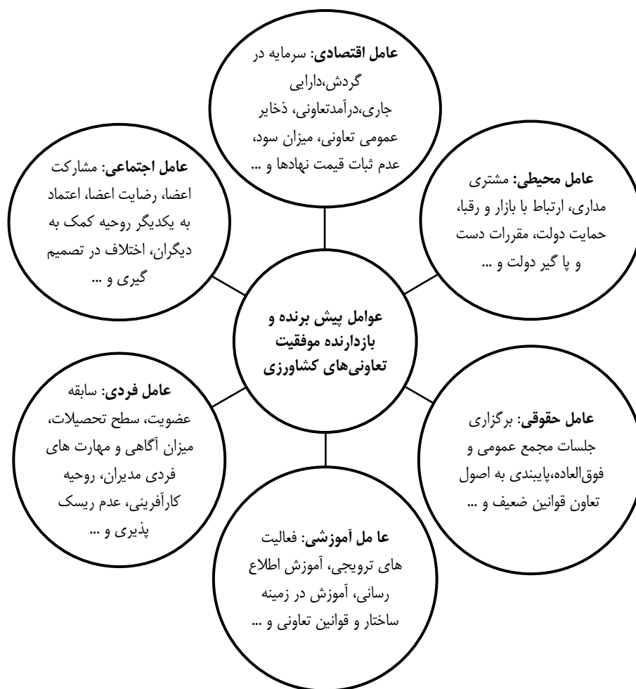
نمودار ۱. مدل مفهومی تحقیق