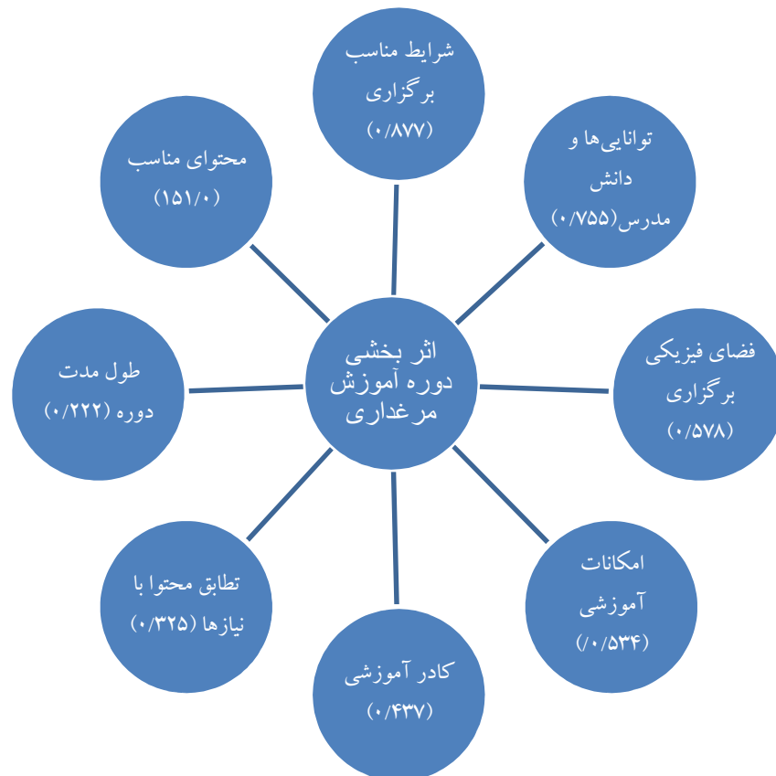
شکل ۲. سهم هر یک از متغیرها بر اساس ضریب بتا

اما قضاوت در مورد سهم و نقش هر یک از ۸ متغیر مذکور در تبیین متغیر وابسته را باید به مقادیر بتا (ضریب استاندارد شده) واگذار کرد، زیرا این مقادیر امکان مقایسه و تعیین سهم نسبی هر یک از متغیرها را فراهم می‌سازد. بر این اساس، سهم شرایط مناسب برگزاری دوره بیشتر از سایر متغیرهای وارد شده به معادله رگرسیونی می‌باشد، زیرا بر پایه بتای به دست آمده (۰/۸۷۷) برای شرایط مناسب برگزاری، به ازای یک واحد تغییر در انحراف معیار به اندازه ۰/۸۷۷ در انحراف معیار متغیر وابسته تغییر ایجاد می‌گردد. میزان بتای هر یک از متغیرهای مورد بررسی در شکل ۲ نشان داده شده است.