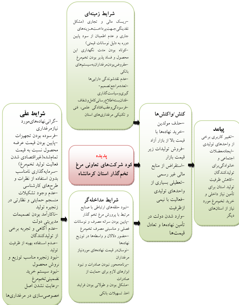
شکل ۲. مدل پارادایمی پدیده رکود شرکت‌های تعاونی مرغ تخم‌گذار استان کرمانشاه