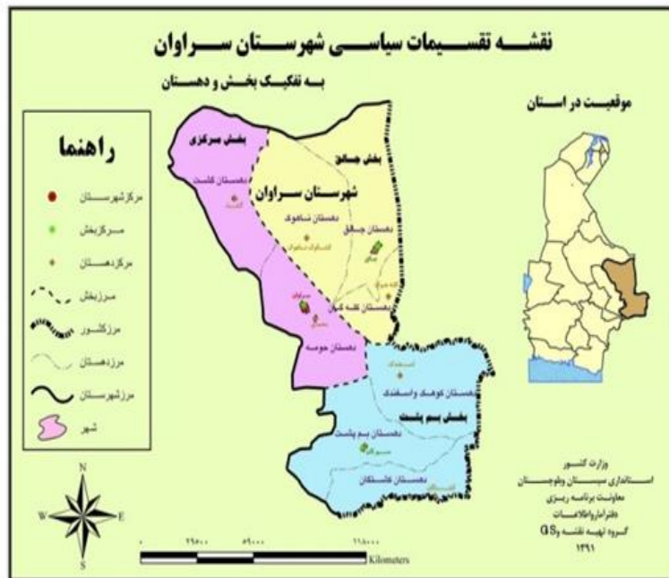
شکل ۲. نقشه تقسیمات سیاسی شهرستان سراوان